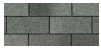
Harvard Slate · Ardoise « Harvard »