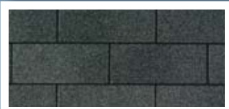
Dual Black · Noir double