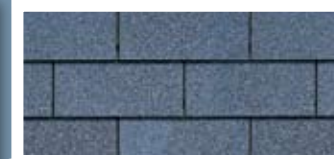
National Blue** · Bleu national**