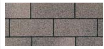
Driftwood · Bois flottant