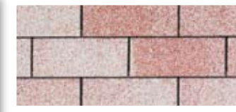
Rainbow Red · Rouge arc-en-ciel