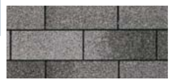
Charcoal Grey · Gris charbon