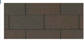
Heatherwood · Bois cendré