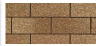
Earthtone Cedar · Cèdre « Earthtone »