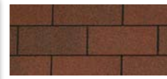
Riviera Red · Rouge riviera