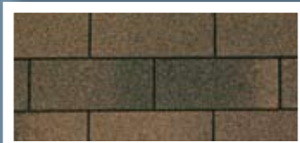
Dual Brown · Brun double