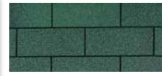
Forest Green · Vert forêt