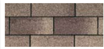
Weatherwood · Bois de grange