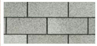
Dual Grey · Gris double