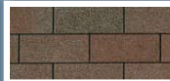
Aged Redwood · Séquoia vieilli